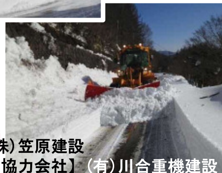
(株)笠原建設 【協力会社】(有)川合重機建設