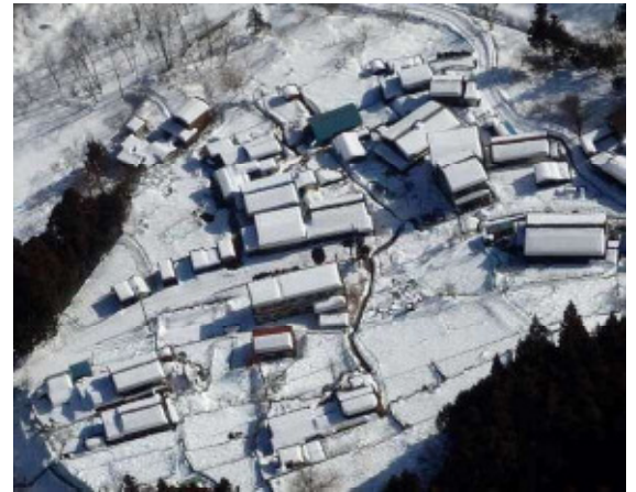
孤立した埼玉県秩父市(中津川集落)

平成26年2月14日から15日にかけて関東甲信地方を襲った記録的豪雪により、広範囲で孤立集落や道路の全面通行止めが発生。