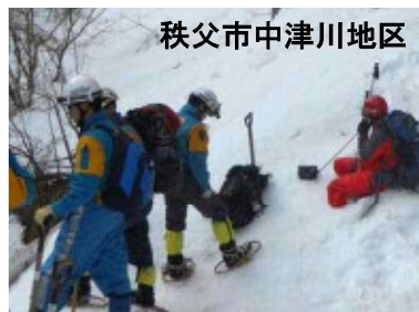
秩父市中津川地区